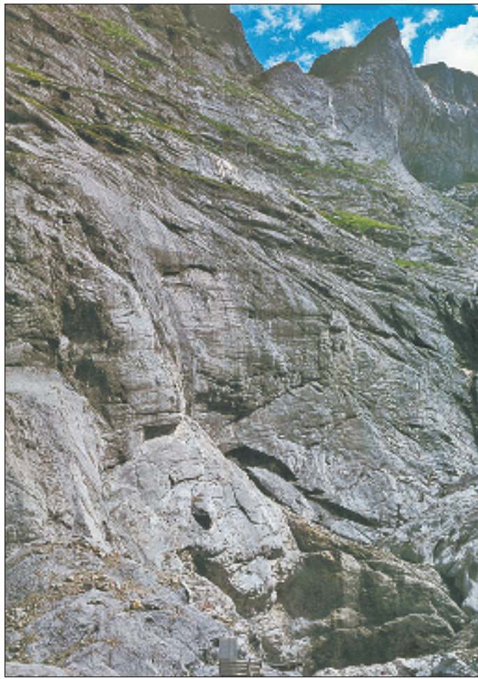
Gletscherschwund am Grindelwaldgletscher dokumentiert: Nur 100 Jahre trennen die beiden Aufnahmen, 1902/2002.