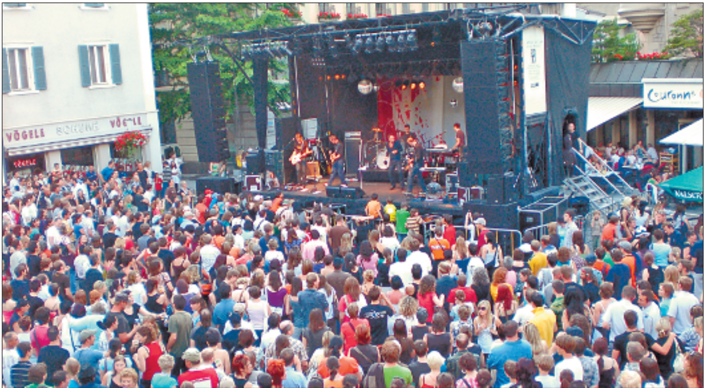
Züri West eröffnete den Reigen der diesjährigen Sommer-Gratiskonzertere in Brig.

Gratiseintritte zogen viele Leute an und sorgten für gute Ambiance