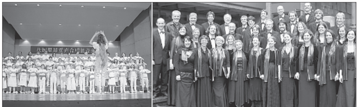
Das Oberwalliser Vokalensemble (rechts) ist Patenchor von «La Cigale de Lyon».